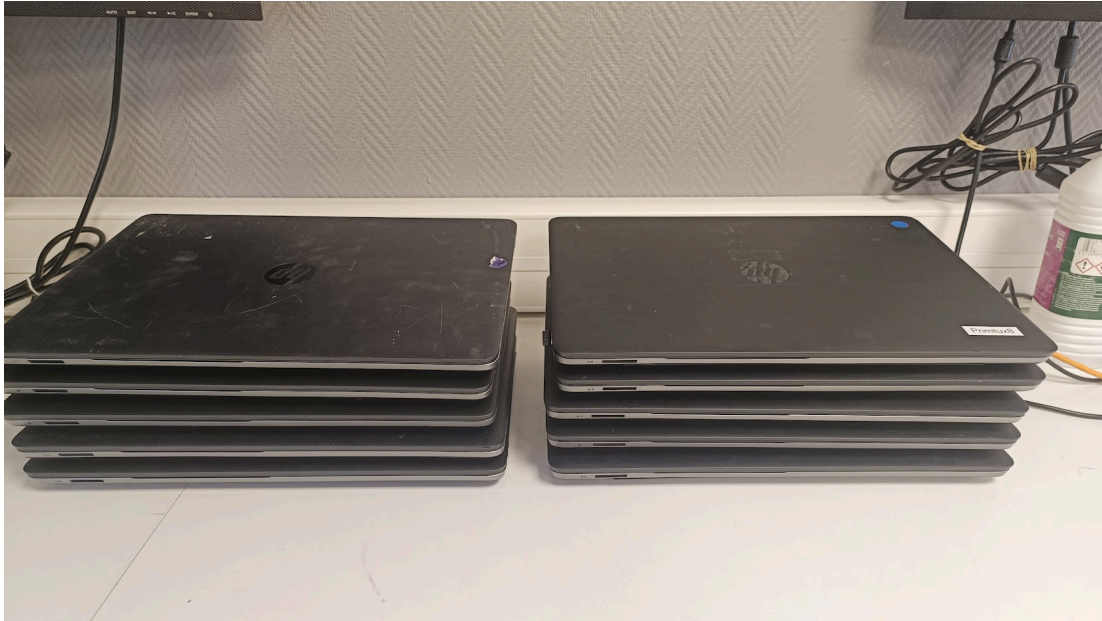
Figure 2 – Les 10 postes HP ProBook équipés de leur SSD, prêts pour l'installation d'Ubuntu MATE 24.04

Une fois les remplacements effectués sur l'ensemble des 10 machines, celles-ci ont été regroupées et vérifiées visuellement avant de procéder à l'installation du système d'exploitation. Toutes les machines démarraient correctement et reconnaissaient le nouveau SSD dans le BIOS.