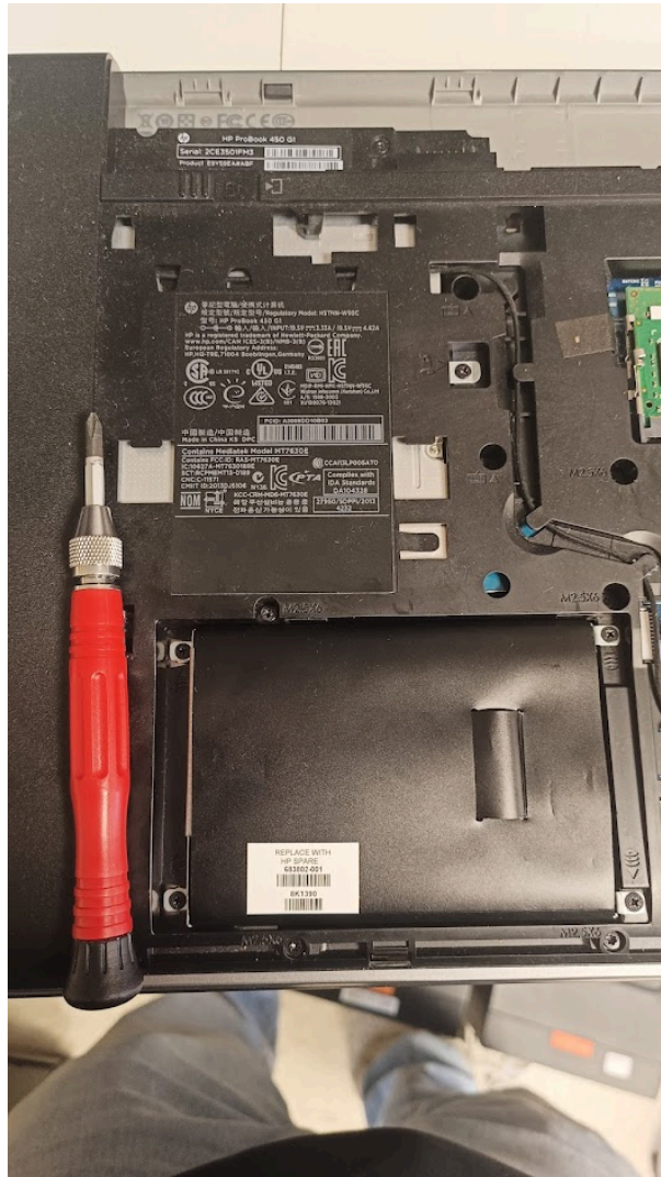
Figure 1 – Démontage du disque dur pour remplacement par un SSD sur les 10 postes