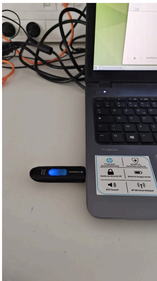
Figure 3 – Clé USB bootable contenant l'image d'installation Ubuntu MATE 24.04 LTS

L'image du système d'exploitation a été préalablement gravée sur une clé USB à l'aide d'un outil de création de média bootable (Rufus). Cette clé USB sert de support d'installation universel pour l'ensemble des postes, garantissant une source d'installation identique et maîtrisée.